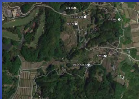
ジャイアントパンダの竹

また、来園者にパンダのハズバンドリートレーニングを見ていただくことで、動物園での健康管理など教育普及にもつなげることが出来るのではないかと考えている。