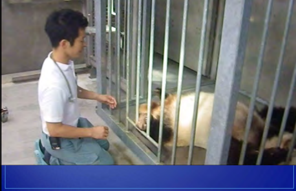
腹部触診と体温測定