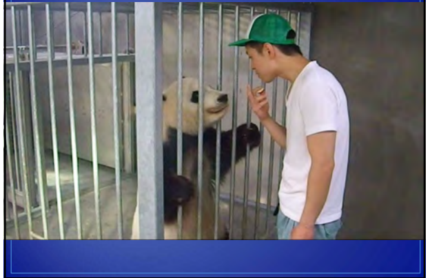
眼、耳、鼻の状態と胸部触診